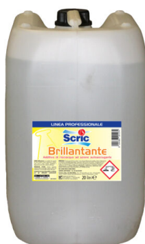
Brillantante per lavastoviglie