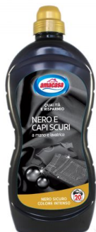
Nero e Capi Scuri Mano/Lavat. 20 Lavaggi