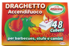
Draghetto Accendifuoco 48 cubi