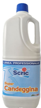
Scric Candeggina Classica