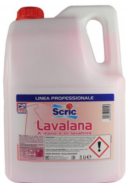
Scric Lavalana 90 Lavaggi