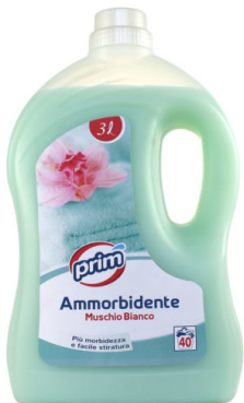
Ammorbidente Muschio Bianco 40 Lavaggi