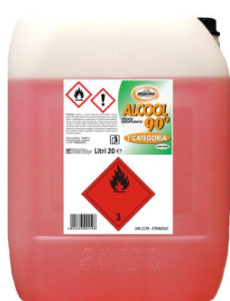
Alcool Etilico Denaturato 90°