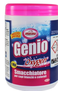
Genio Oxygen Smacchiatore Capi Bianchi e Colorati