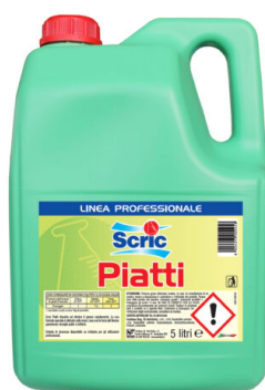
Scric Piatti Limone Concentrato