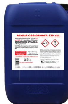
Acqua Ossigenata 130 Volumi