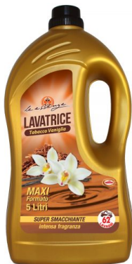
Lavatrice Tabacco e Vaniglia 62 Lavaggi