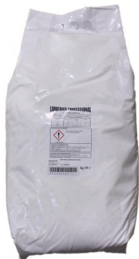
Sacco Lavatrice Polvere Professional