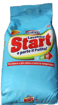
START Lavatrice 72 misurini