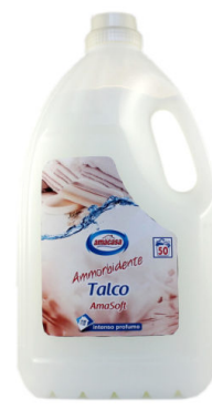
Amasoff Ammorbidente Talco 50 Lavaggi