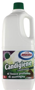
Candigiene Profumo di Montagna