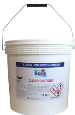
Scric Cloro Pastiglie