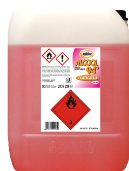
Alcool Etilico Denaturato 94°