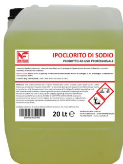
Cloro Puro 15/18%