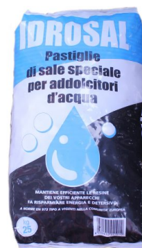
Sale in Pastiglie per Addolcitori