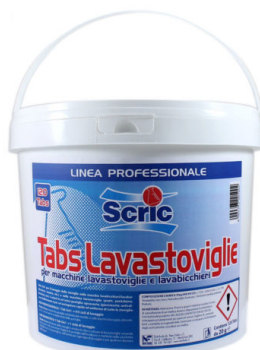
TAB 5in1 Lavastoviglie Fustino