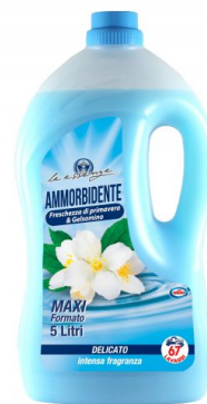
Ammorbidente Primavera e Gelsomino 67 Lavaggi