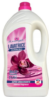
Lavatrice Orchidea Nera 62 Lavaggi