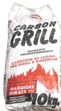
Carbonella Professional per Barbecue