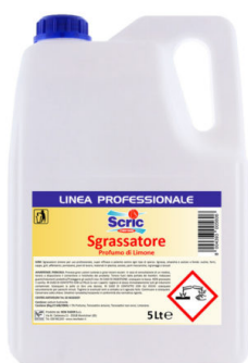
Scric Sgrassatore Limone