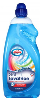
Lavatrice Classico Gel 17 Lavaggi