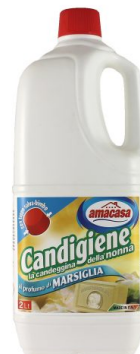
Candigiene Profumo di Marsiglia