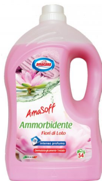
Amasoff Ammorbidente Fiori di Loto 54 Lavaggi