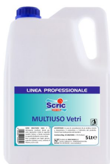
Scric Multiuso Vetri