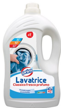
Lavatrice Classico Fresco Profumo 42 Lavaggi