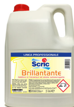
Scric Brillantante per Lavastoviglie