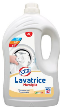
Lavatrice Marsiglia 42 Lavaggi