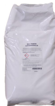
Sacco Lavastoviglie Polvere