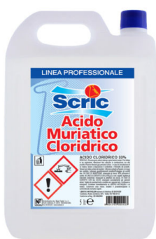
Scric Acido Puro al 33%