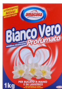
Bianco Vero Profumato