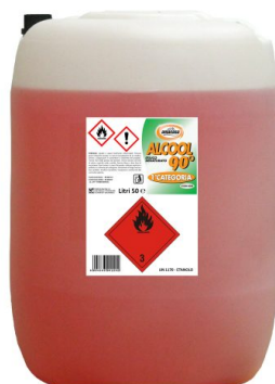
Alcool Etilico Denaturato 90°