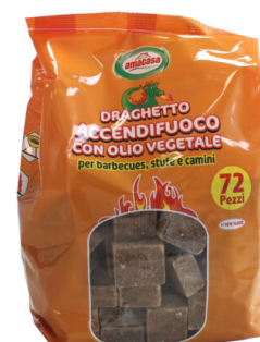
Draghetto Accendifuoco Ecologico 72 cubi