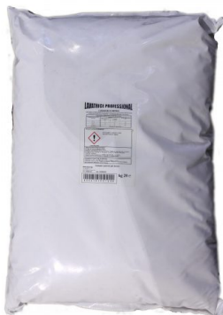
Sacco Lavatrice Polvere Professional