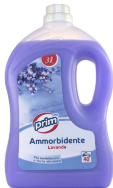
Ammorbidente Lavanda 40 Lavaggi