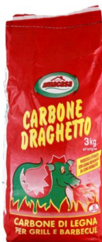
Draghetto Carbonella per Barbecue