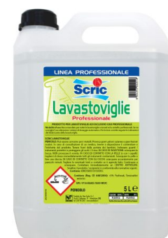
Scric Lavastoviglie Professionale