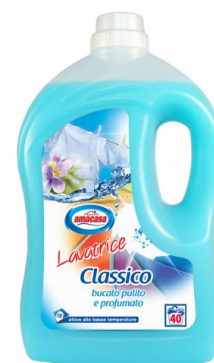
Lavatrice Classico 40 Lavaggi