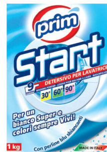
START Lavatrice Polvere 9 Lavaggi