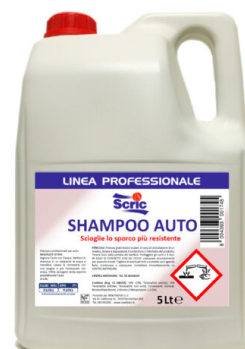
Scric Shampoo Auto