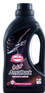
Amadark Color Capi Scuri e Colorati 16 Lavaggi