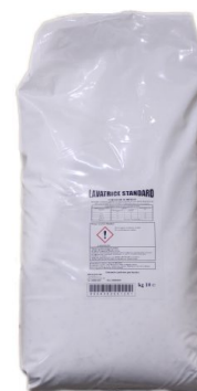
Sacco Lavatrice Polvere Standard