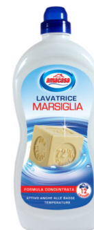
Lavatrice Marsiglia 12 Lavaggi