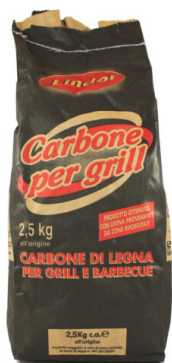
Carbonella per Barbecue kg 2,5