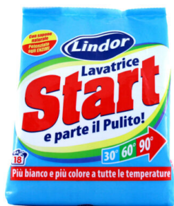
START Lavatrice 18 misurini