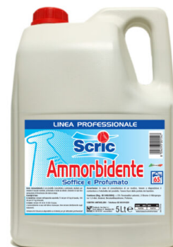
Scric Ammorbidente Classico 65 Lavaggi