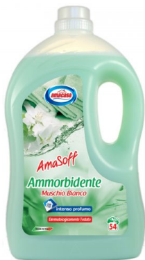
Amasoff Ammorbidente Muschio Bianco 54 Lavaggi