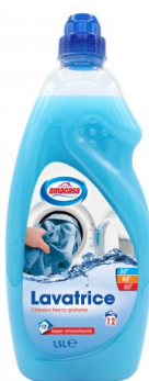
Lavatrice Classico 12 Lavaggi