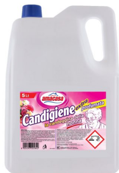
Candeggina della Nonna Floreale