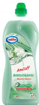
Amasoff Ammorbidente Muschio Bianco 27 Lavaggi