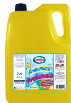
Ammoniaca Profumata con Detergente