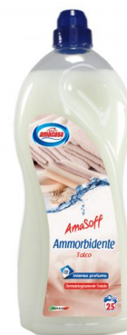
Amasoff Ammorbidente Talco 25 Lavaggi