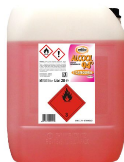
Alcool Etilico Denaturato 94°