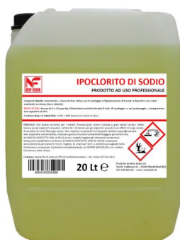
Cloro Puro 15/18%