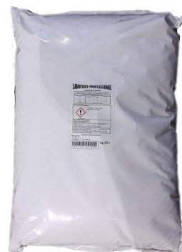
Sacco Lavatrice Polvere Professional