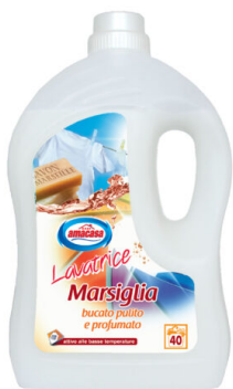
Lavatrice Marsiglia 40 Lavaggi