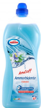
Amasoff Ammorbidente Classico 27 Lavaggi