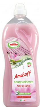
Amasoff Ammorbidente Fiori di Loto 27 Lavaggi