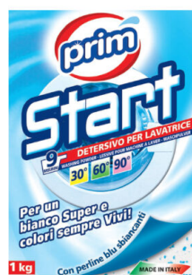
START Lavatrice Polvere 9 Lavaggi