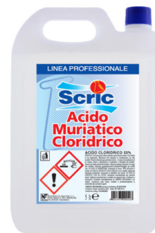
Scric Acido Puro al 33%