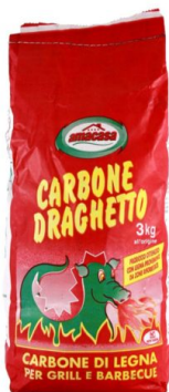
Draghetto Carbonella per Barbecue