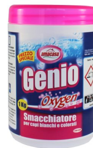
Genio Oxygen Smacchiatore Capi Bianchi e Colorati