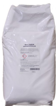
Sacco Lavastoviglie Polvere