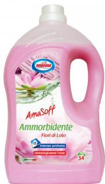
Amasoff Ammorbidente Fiori di Loto 54 Lavaggi