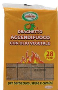
Draghetto Accendifuoco con Olio Vegetale 28 cubi