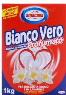
Bianco Vero Profumato