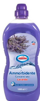
Ammorbidente Concentrato Lavanda 40 Lavaggi