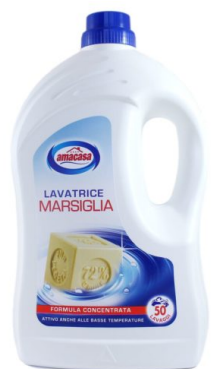
Lavatrice Marsiglia 50 Lavaggi