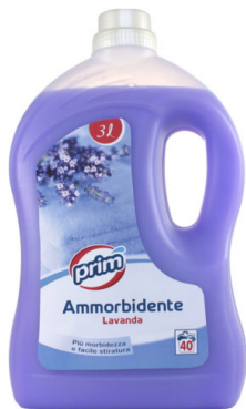
Ammorbidente Lavanda 40 Lavaggi