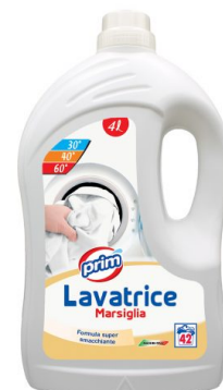
Lavatrice Marsiglia 42 Lavaggi