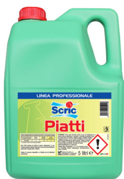
Scric Piatti Limone Concentrato