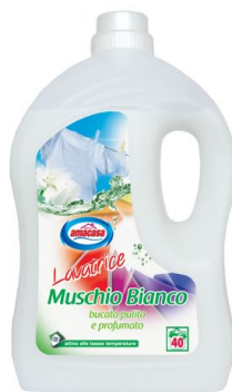
Lavatrice Muschio Bianco 40 Lavaggi