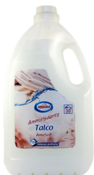
Amasoff Ammorbidente Talco 50 Lavaggi