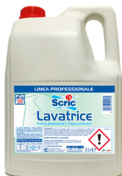
Scric Lavatrice 50 Lavaggi