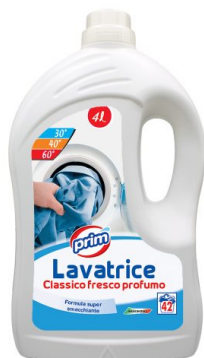
Lavatrice Classico Fresco Profumo 42 Lavaggi