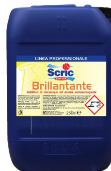
Brillantante per lavastoviglie