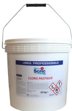
Scric Cloro Pastiglie