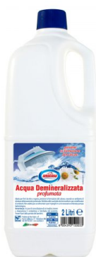
Acqua Demineralizzata Profumata