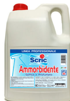
Scric Ammorbidente Classico 65 Lavaggi