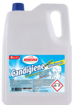
Candeggina della Nonna