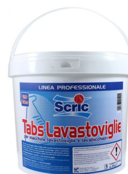
TAB 5in1 Lavastoviglie Fustino