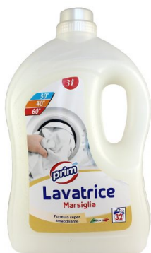
Lavatrice Marsiglia 32 Lavaggi