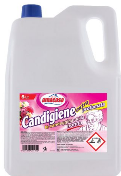
Candeggina della Nonna Floreale