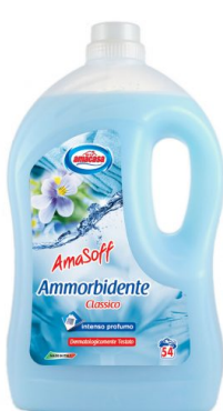
Amasoff Ammorbidente Classico 54 Lavaggi