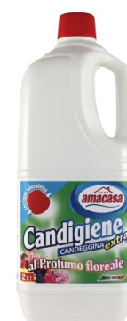
Candigiene Profumo Floreale