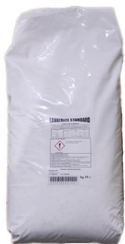
Sacco Lavatrice Polvere Standard