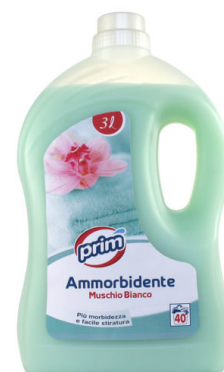
Ammorbidente Muschio Bianco 40 Lavaggi