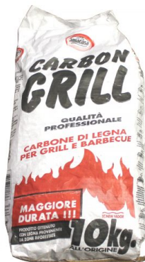
Carbonella Professional per Barbecue