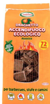
Draghetto Accendifuoco Ecologico 72 cubi