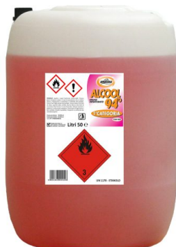
Alcool Etilico Denaturato 94°