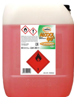
Alcool Etilico Denaturato 90°