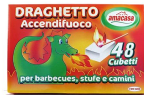
Draghetto Accendifuoco 48 cubi