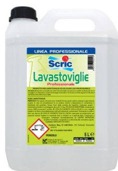
Scric Lavastoviglie Professionale