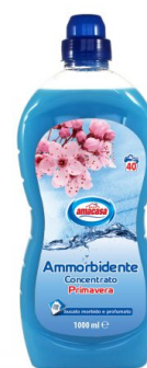
Ammorbidente Concentrato Primavera 40 Lavaggi