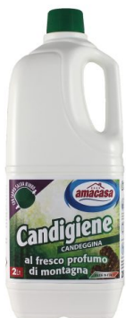
Candigiene Profumo di Montagna