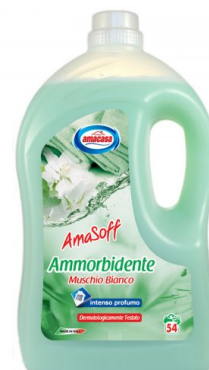
Amasoff Ammorbidente Muschio Bianco 54 Lavaggi