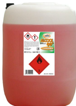
Alcool Etilico Denaturato 90°