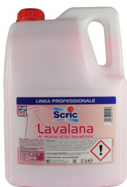
Scric Lavalana 90 Lavaggi