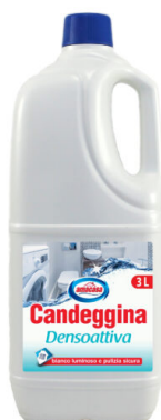
Candeggina Densoattiva Lt 3