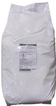
Sacco Lavatrice Polvere Professional