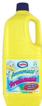
Ammoniaca Profumata con Detergente