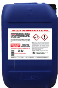
Acqua Ossigenata 130 Volumi