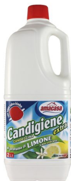
Candigiene Profumo di Limone