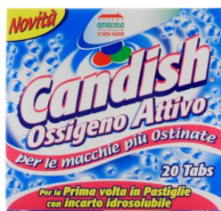
Candish Ossigeno Attivo 20 Tabs