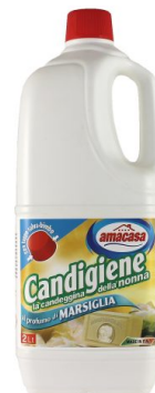
Candigiene Profumo di Marsiglia