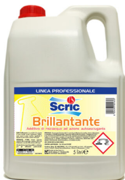
Scric Brillantante per Lavastoviglie