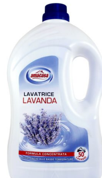
Lavatrice Lavanda 50 Lavaggi